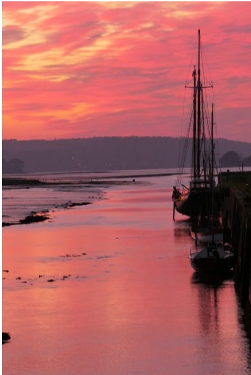
© FS «Au port du Faou »

À BIENTÔT ! VOTRE PROFESSEUR DOCUMENTALISTE